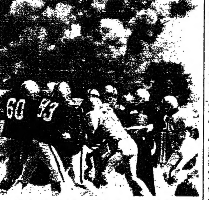
اجزاء فريق اولاد رابندر لكري يتدربون في الحريق